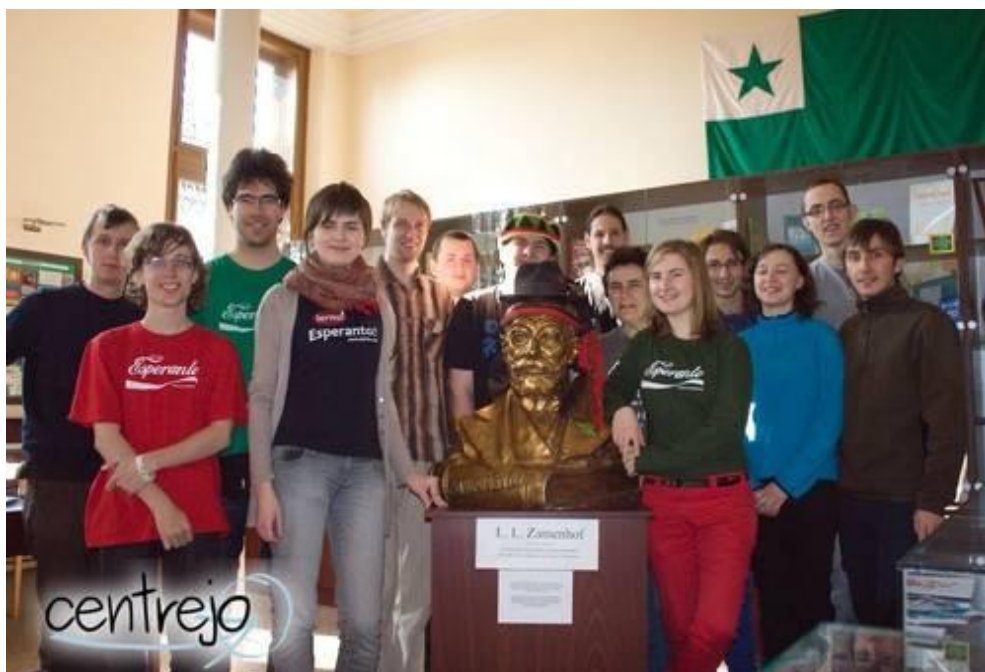
Obrázek 5 Účastníci mezinárodního setkání