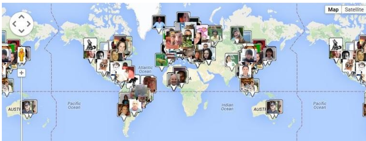
Obrázek 9 Světová mapa kontaktů muzea

V r. 2014 přibylo v síti muzea cca 130 nových kontaktů, mj. např. v Japonsku, Estonsku, Brazílii, Austrálii či Pákistánu. V uplynulém roce byly posíleny i kontakty s neesperantisty např. v Německu, Francii a USA, s nimiž jsme sdíleli kulturně zeměpisné fotografie.