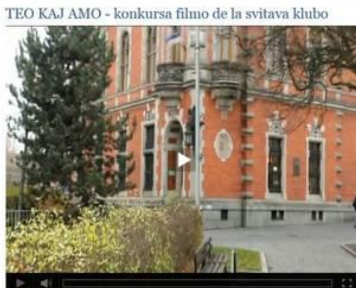
Obrázek 6 Soutěžní snímek klubu

V listopadu 2014 členové svitavského klubu natočili desetiminutový snímek do soutěže filmů v esperantu na téma "ČAJ A LÁSKA", vyhlášené CHINA RADIO INTERNACIA (Mezinárodním čínským rozhlasem). Výsledky soutěže budou oznámeny koncem března 2015, na výsledcích se podílejí i diváci na internetu svým hlasováním. Je dostupný taktéž na serveru Youtube .