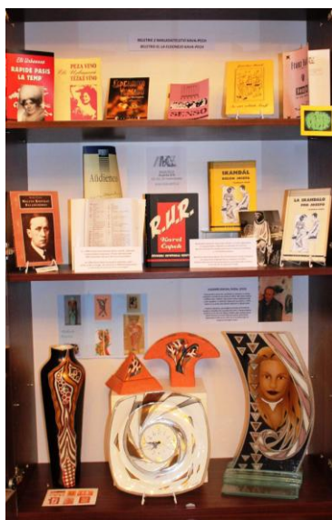
Obrázek 2 Vitrína k výstavě "Esperanto a múzy"

Současná expozice je u příležitosti konání Celostátní filatelistické výstavě ve Svitavách věnována tématu: " Esperanto a sběratelství " ( Esperanto kaj kolektado ). Exponáty pochází z více než 40 zemí světa od 15 vystavovatelů. Vernisáž výstavy proběhla 27. září 2014 za přítomnosti několika desítek účastníků z celé ČR a s hosty ze Slovenska, Rakouska a Nizozemí.